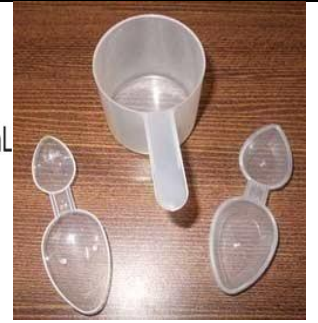
نمونه هایی از کاپ دارویی که برای دادن شربت ها استفاده میشود.