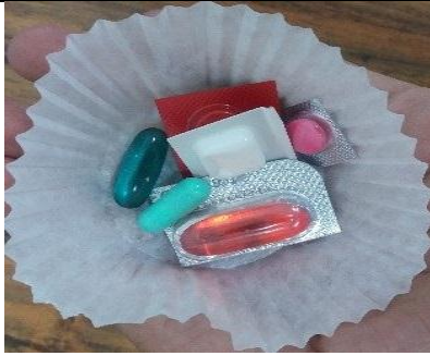
نمونه کاپ دارویی که برای دادن قرص و کپسول به مددجواستفاده میشود.