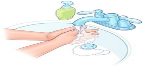
دست ها را بشوید