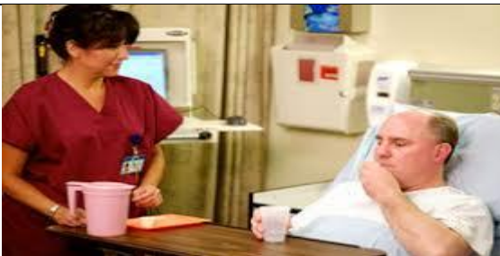
دارو را همراه با یک لیوان آب به مددجو بدهید و تا زمان بلع کامل دارو کنار مددجو بمانید.