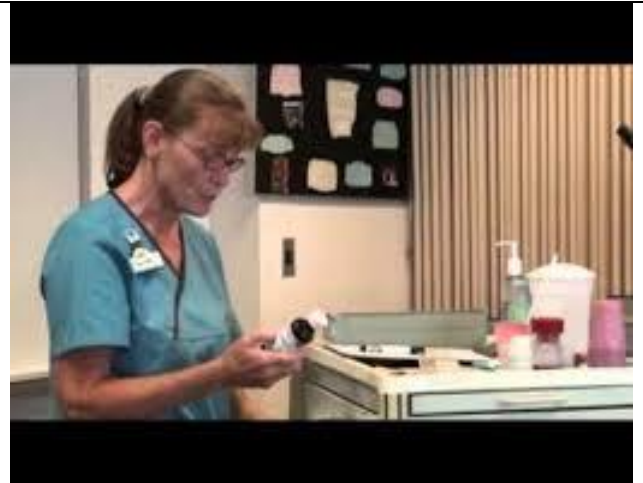
مشخصات، نام و تاریخ داروی مورد نظر را چک کنید.