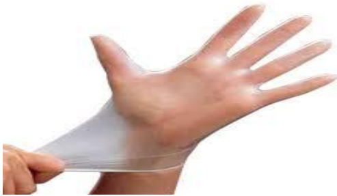
دستکش تمیز بپوشید.